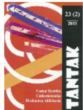
Tantak Aldizkaria EHUKO ARGITALPEN ZERBITZUA Kalean da 23. bolumeneko 2. zenbakia. Honako gaiak jorratu ditu: Internet LHn, Ordenagailu bidezko ikaskuntza IKASYS proiektuaren ebaluazioa, Irakaslearen eta unibertsitatearen rola ikasleen informazio-kompetentzien garapenean, Kultura arteko komunikazio gaitasuna eta abar. •