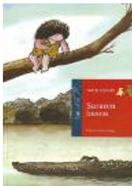
Sararen basoa Emilio Urberuaga/ Nekane Umerez IBAIZABAL

Hegoaldeko mutiko baten gogoe-tak, iparraldeko aittaren etxean. Egun berriaren esnaera, senide berriarekin topo egitea, leihoaz bestaldeko errealtatea eta iragana talkan eta, azkenik, bizitza berriaren onarpena. Narrazio poetiko edo poesia narratibo honek, gaztea egoera berrira nola egokitzen den kontatuko digu. 14 urtetik gorakoentzat. •