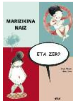
Marizikina naiz, eta zer? Uxue Alberdi/ Eider Eibar ELKAR

Sara basoan bizi da, baina bertako animaliak ez daude gustura daukaten itxurarekin. Haginen ordezkaria mokoia nahi dute batzuek, edo lepaluzeen lepoa... Ametsetan Sarakerabat perfektua den animalia sortuko duen arren, berehala konturatuko da ez dela hori animaliek nahi dutena, ez dute perfektuak izan nahi. 5 urtetik gorakoentzat. •