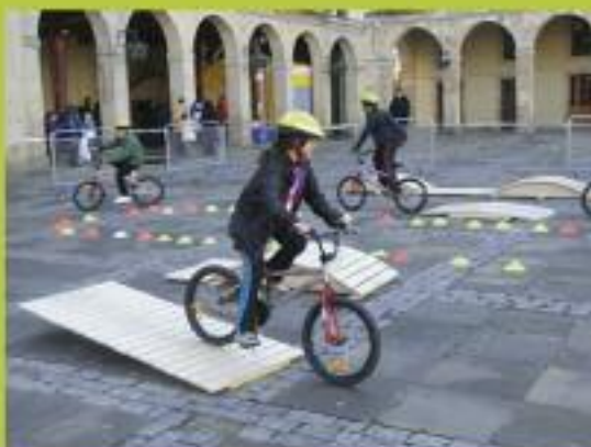
Joko-jolas eta ekintza ezberdinen antolaketa