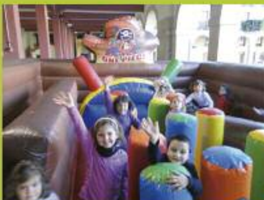
Ikasturte amaierako festak